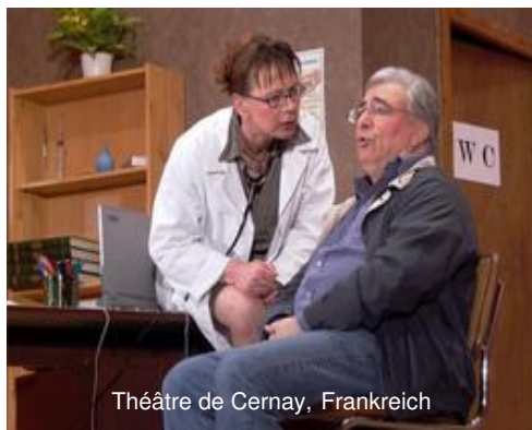
Théâtre de Cernay, Frankreich