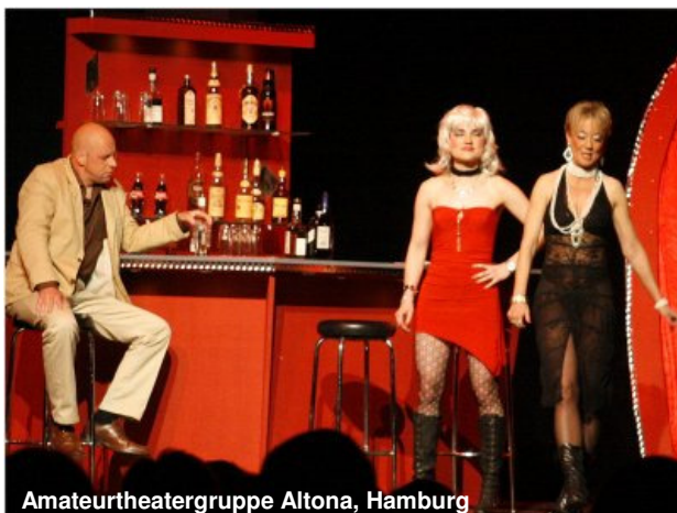
Amateurtheatergruppe Altona, Hamburg

In Palermo konkurrieren zwei Familienclans um die Vorherrschaft um Drogen- und Waffengeschäfte sowie um Schutzgeld-Erpressungen. Die Witwe Beatrice und ihre Tochter Giulia betreiben ein Nobel-Bordell, in dem angesehenen Herren aus Politik und Wirtschaft ein- und ausgehen. Ihre Nachbarin Franca, deren Mann im Gefängnis sitzt, führt mit eiserner Hand den Familienbetrieb. Ihre schussfreudige Tochter Marietta ist voll in den Betrieb integriert. Ihr sensibler Sohn Romano soll nun, da er volljährig geworden ist, eingeschult werden. Dafür muss er als Mutprobe und als Vorbereitung für die geschäftlichen Praktiken seinen ersten Mord begehen. Allerdings fühlt er sich nicht zum Killer berufen, sondern möchte viel lieber Polizist werden. Romano und Giulia lieben sich, trauen sich jedoch nicht, es ihren Müttern zu sagen. Als eines Tages Franca tot aufgefunden wird, haben mehrere Beteiligten ein Motiv: Hat Romano seinen ersten Mord ausgerechnet an seiner Mutter begangen? Oder war es doch ihre Tochter, mit der sie sich dauernd gestritten hat? War es ein dubioser Bankier, der sie eiskalt ermordete, weil sie zu viel wusste? Oder ist ihre Rivalin Beatrice einer umtriebigen Auftragskillerin zuvor gekommen?