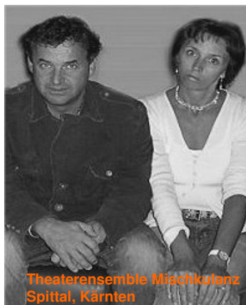
Theaterensemble Mischkulanz Spittal, Kärnten