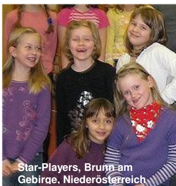
Star-Players, Bruin am Gebirge, Niederösterreich

Schneewittchen und der Prinz haben geheiratet und sechs Kinder bekommen. Schneewittchen hat Karriere gemacht. Dass einer in der Familie das Geld nach Hause bringt, ist auch bitter nötig, denn vom ehemaligen Reichtum der Familie ist im Laufe der Jahrhunderte nichts übrig geblieben. Der Prinz, der es nie gewohnt war „richtig“ zu arbeiten, hat beschlossen, Hausmann zu werden. Irgend jemand muss sich schließlich auch um die Kinder kümmern! Das Familienleben scheint eigentlich ganz gut zu funktionieren – wäre da nicht die böse Stiefmutter, die immer noch gern – so wie damals – vergiftete Äpfel serviert. Als zu allem Überfluss auch noch Aschenputtel auftaucht, die Schneewittchen ihren Mann ausspannen will, droht die „Idylle“ vollends aus dem Ruder zu geraten, denn Aschenputtel ist die Lieblichkeit in Person. Wird der Prinz widerstehen können?