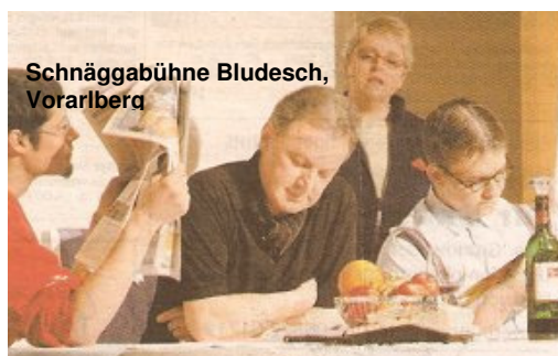
Schnäggabühne Bludesch, Vorarlberg

Fridolin wurde von seiner Verlobten verlassen. Da er zudem arbeitslos wurde und er sich allein die Miete nicht leisten kann, gibt er ein Inserat auf, um drei männliche Mitbewohner zu suchen – von Frauen will er zumindest in nächster Zeit nichts mehr wissen!